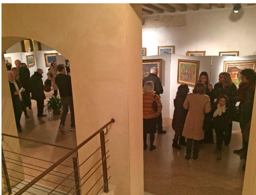
Visitatori nelle sale dell'esposizione