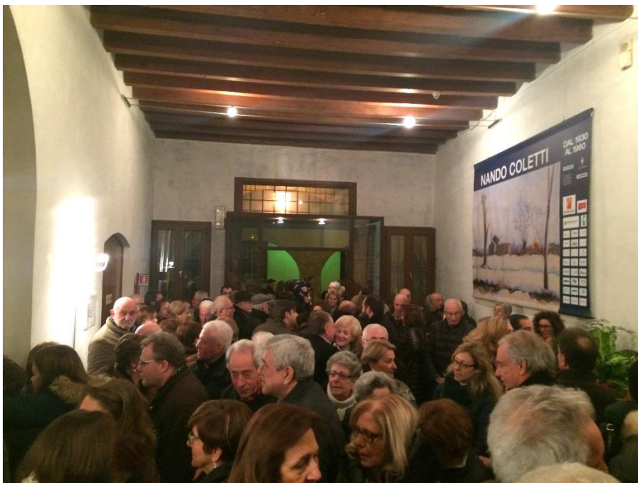
La coda in attesa di poter salire al primo piano per vedere l'esposizione

www.associazioneeventiartisticitreviso.com