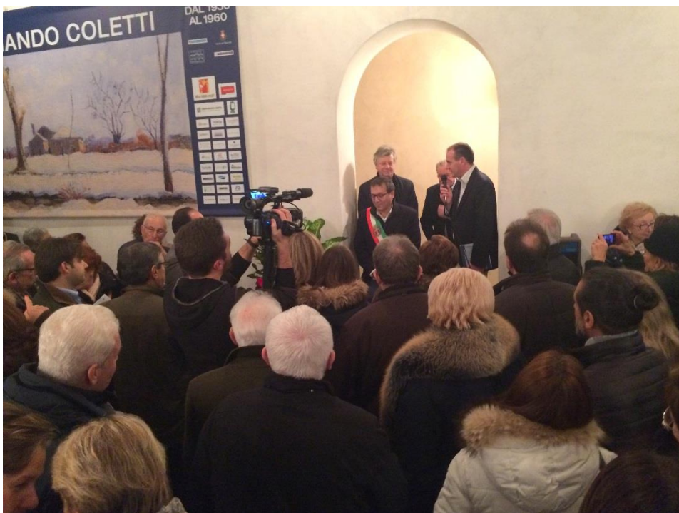
Intervento Presidente E.A.T.