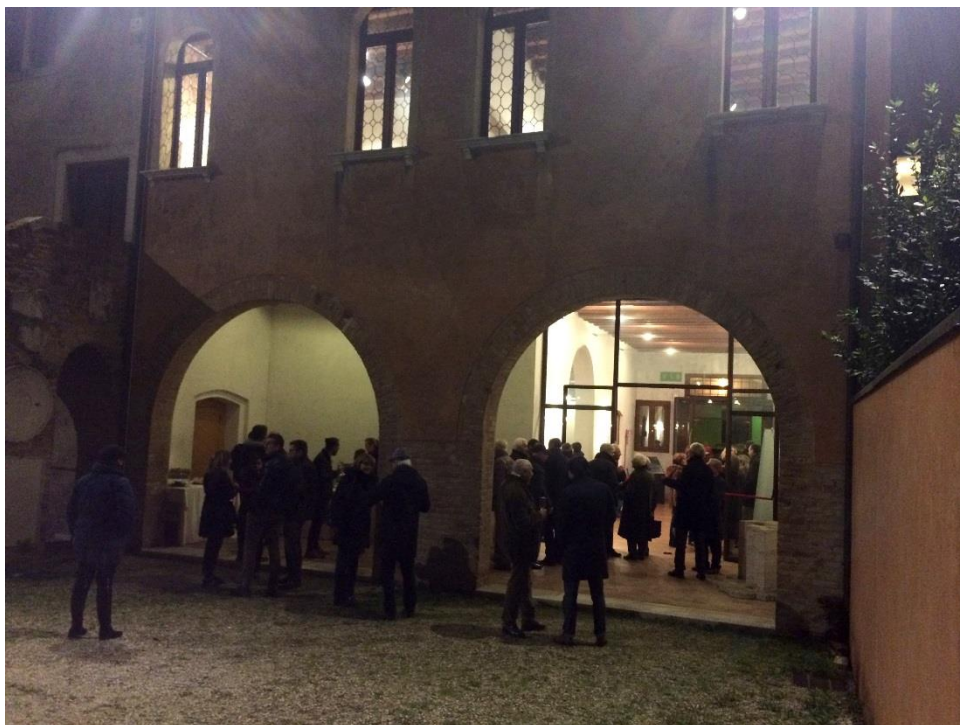
La gente in strada in attesa di poter entrare