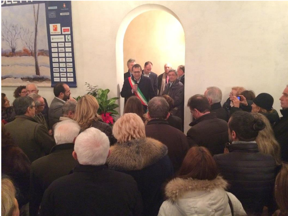
Intervento del Sindaco

www.associazioneeventiartisticitreviso.com