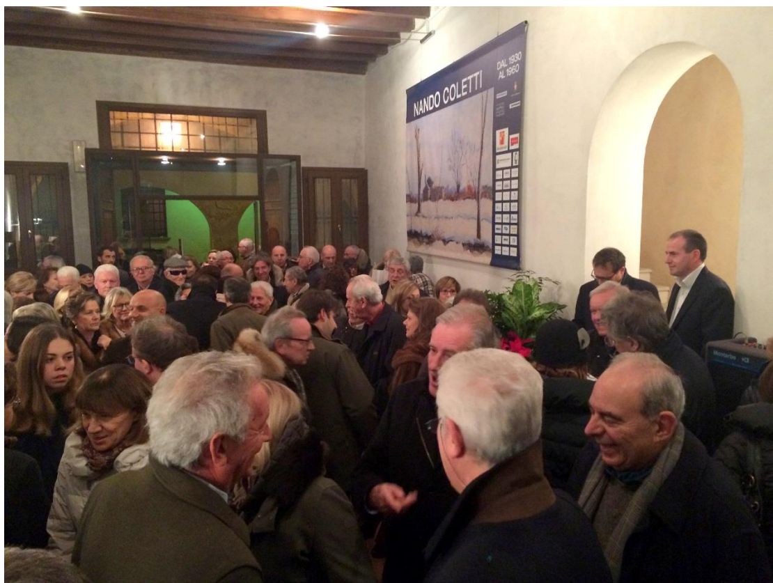
Gente in attesa dell'inaugurazione